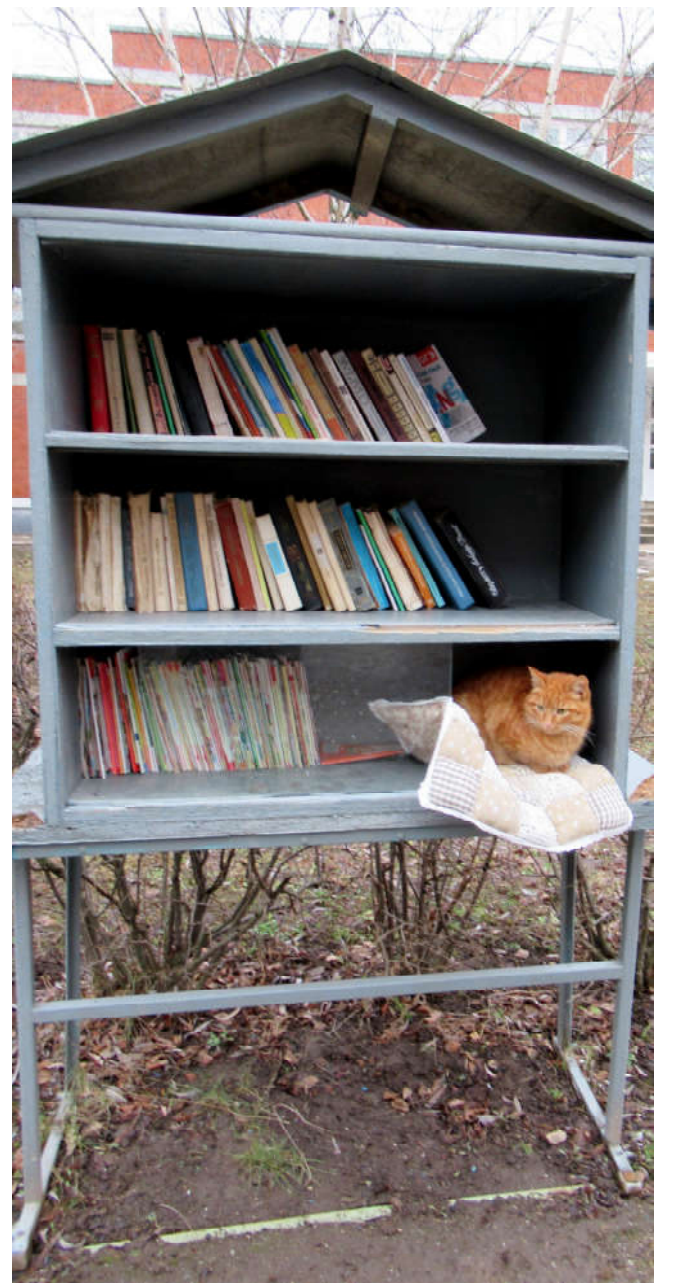
Уличная библиотека и «библиотекарь» (п. Воротынский).